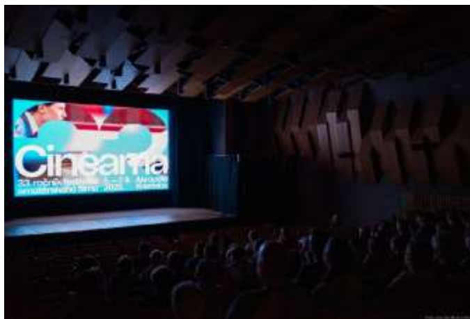
Cineama festival 2025