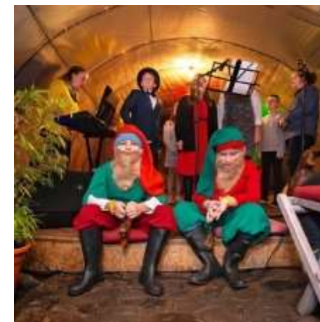
Salamander očami detí