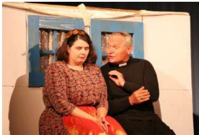
Melekova divadelná Nová Baňa 2025