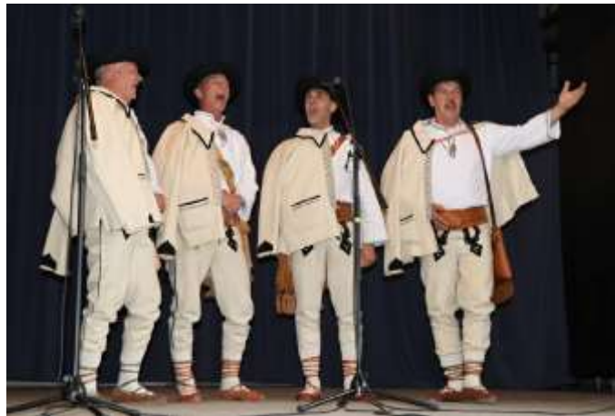
Vidiečanova Habovka 2025