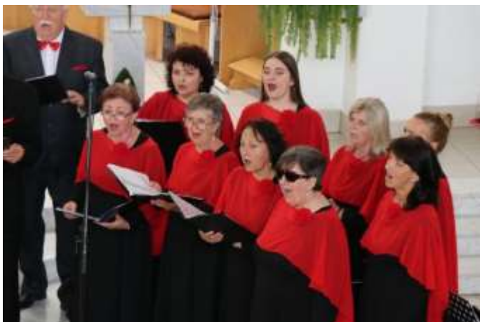
Viva il canto 2025