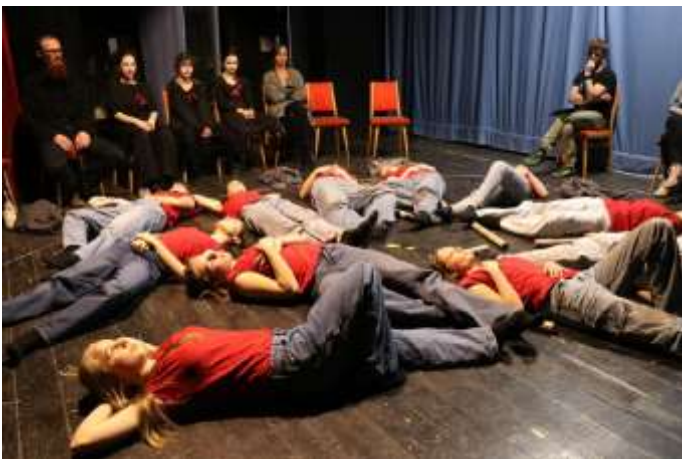
Hviezdoslavov Kubín 2025