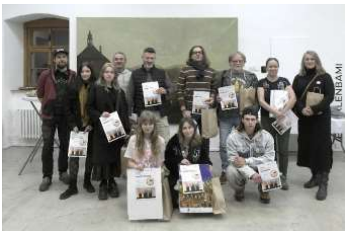
Najkrajšia dovolenková fotografia 2025