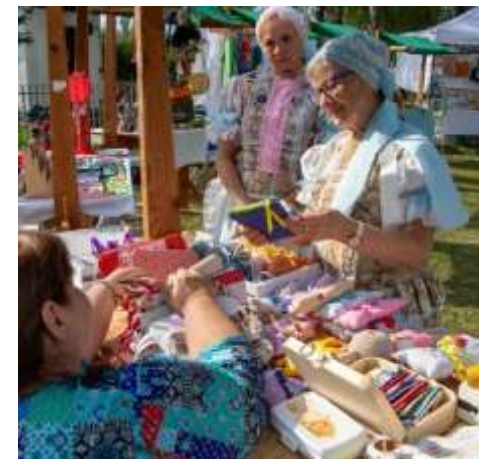
Žiarsky festival remesiel 2025