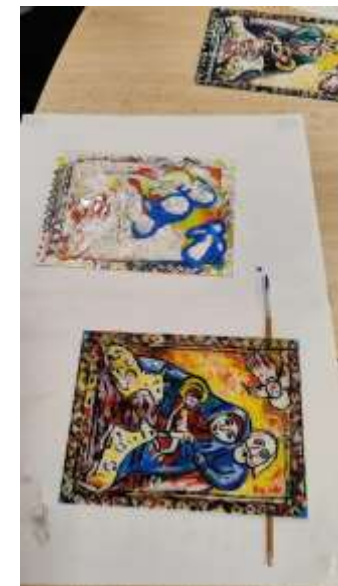
Zabudnuté remeslá – Maľovanie na sklo