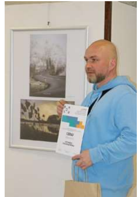
AMFO 2025 - regionálne kolo