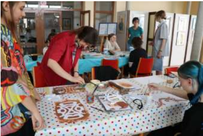
Textilná tvorba 2025 – Tlač a farbenie textilu